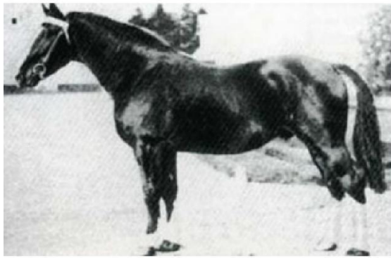
Vas Y Donc

Urioso var linjeavlade på den franske Vas Y Donc, även han hade travarblod i stammen då han går tillbaka på den kände Cherbourg.